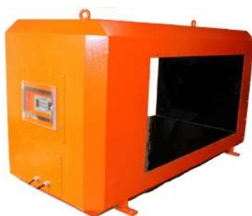
SAFETY SYSTEM DMP 8000