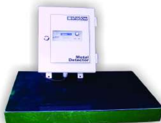
KS 05 MADEIREIRAS

Foi projetado para funcionar em esteiras transportadoras de